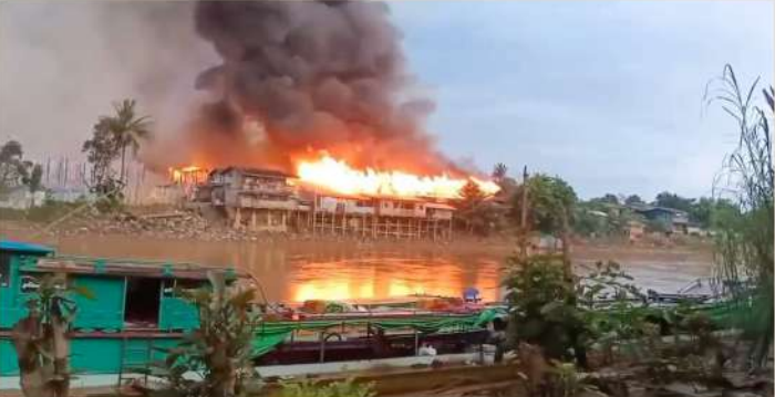
ဆယ်ဇင်းဒေသ မီးရှို့ဖျက်ဆီး ဓာတ်ပုံ (လူမှုကွန်ယက်)