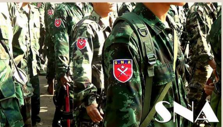
ရှမ်းနီပြည်သူ့စစ်(SNA) ဓာတ်ပုံ (လူမှုကွန်ယက် )